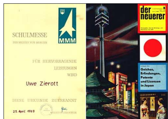
MMM-Urkunde, Zeitschriften-Cover.

Ab 1965 erschien sie als Der Neuerer – Zeitschrift für Erfindungs- und Vorschlagswesen im Verlag Die Wirtschaft . Sie wurde im 39. Jahrgang mit der Ausgabe 4/1990 eingestellt.