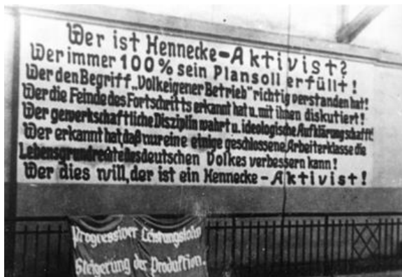
Propagandaplakat der Henneke-Bewegung in einem volkseigenen Betrieb in der Sowjetischen Besatzungszone.